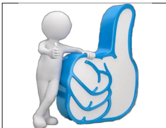
Emblema contenido en el USB o Disco Compacto

En cuanto al análisis del emblema que se adjunta a la manifestación de intención, se advierte que cumple con lo establecido en el considerado XXVIII, así como al Anexo IETAM-CI-A1 de los Lineamientos Operativos.