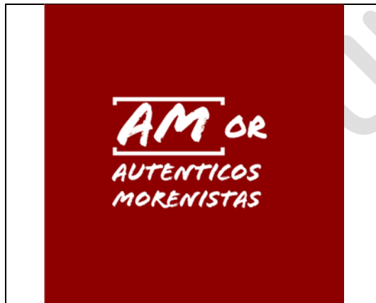
Emblema contenido en el USB o Disco Compacto

En cuanto al análisis del emblema que se adjunta a la manifestación de intención, se advierte que se compone de la siguiente cuatricromía: Rojo E74E35 - CMYK 0,100,100,44 con la leyenda de “Auténticos Morenistas”, donde si bien es cierto el pantone no es igual al de otros partidos políticos, al componerse de un solo color si resulta análogo a alguno de los partidos políticos nacionales con acreditación local.