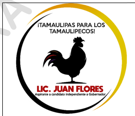
Emblema contenido en el USB o Disco Compacto

En cuanto al análisis del emblema que se adjunta a la manifestación de intención, se advierte que cumple con lo establecido en el considerado XXVIII, así como al Anexo IETAM-CI-A1 de los Lineamientos Operativos.