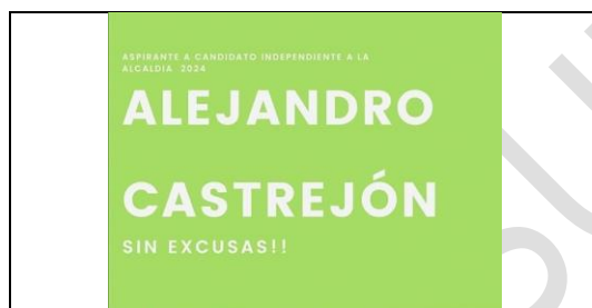
Emblema contenido en el USB o Disco Compacto

En cuanto al análisis del emblema que se adjunta a la manifestación de intención, se advierte que cumple con lo establecido en el considerado XXVII del presente Acuerdo, así como al Anexo 3 de la Convocatoria ( Emblemas y colores de los partidos políticos nacionales con acreditación en el Instituto Electoral de Tamaulipas ).