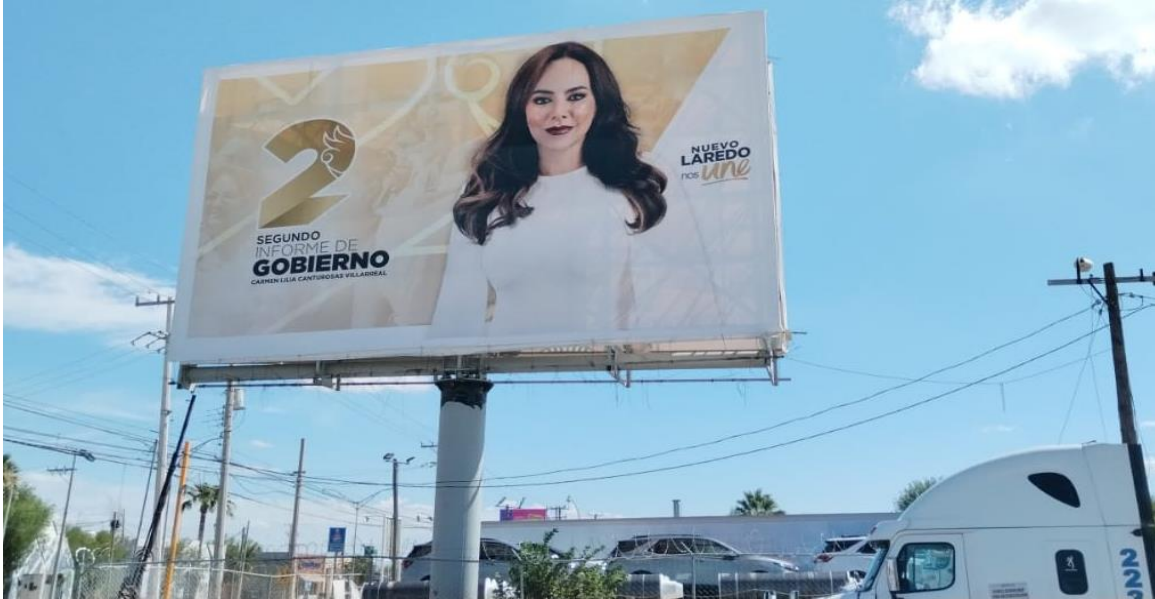
d) Av. Monterrey entre Calle Lago de Texcoco.