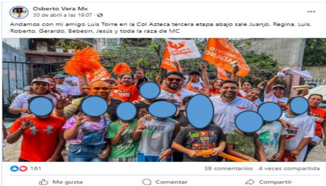
Publicaciones emitidas desde el perfil "Luis Torre".