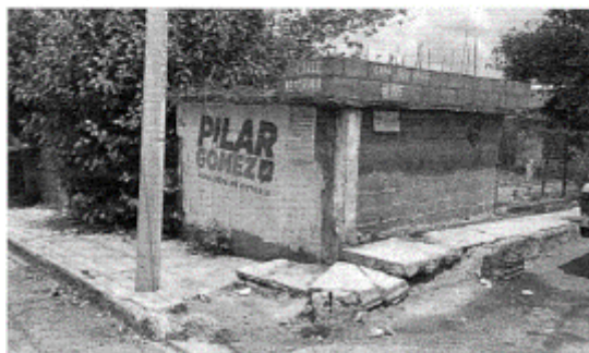
6.- CALLE FRANCISCO VILLA ESQUINA CON CALLE REFORMA, COL. LOS PINOS, C.P. 87140, CIUDAD VICTORIA TAMAULIPAS.