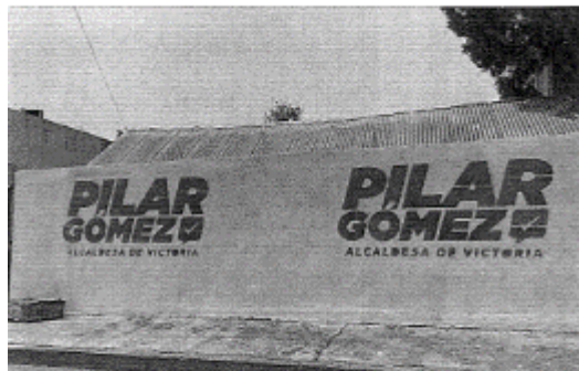
22.- CALLE VICENTE GUERRERO ENTRE PRIVADA GUERRERO BRAVO Y CALLE MARTIRES DE CANANEA, ZONA CENTRO C.P. 87000, CIUDAD VICTORIA, TAMAULIPAS.