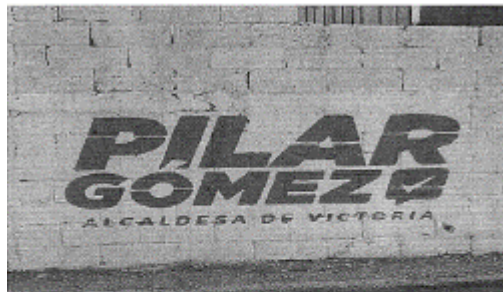
28.- CALLE CITLALIC ENTRE CALLE SOL Y CALLE ZENIT, COL. ESTRELLA, C.P. 87015, CIUDAD VICTORIA, TAMAULIPAS.