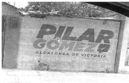
22.- CALLE VICENTE GUERRERO ENTRE PRIVADA GUERRERO BRAVO Y CALLE MARTIRES DE CANANEA, ZONA CENTRO C.P. 87000, CIUDAD VICTORIA, TAMAULIPAS.