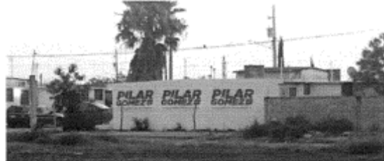
8.- CALLE FRANCISCO DE GUEMEZ ENTRE CALLE TENOCHTITLÁN Y CALLE DEL COMERCIANTE, VALLE DEL MAGISTERIO, C.P. 87089, CIUDAD VICTORIA, TAMAULIPAS.