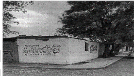
4.- CALLE PANORAMA ESQUINA CON CALLE ALCOR, COL. DIANA LAURA, C.P. 87134, CIUDAD VICTORIA TAMAULIPAS.