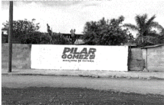
2.- CALLE JAIME RODRIGUEZ INURRIGARO, ENTRE LIRIO Y FLOR DE LIZ, COLONIA MODERNA, CP 87134, CIUDAD VICTORIA, TAMAULIPAS.