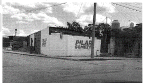
4.- MARTINEZ MANAUTOU ESQUINA CON CALLE LIRIO, COLONIA MODERNA, CP 87134, CIUDAD VICTORIA, TAMAULIPAS.