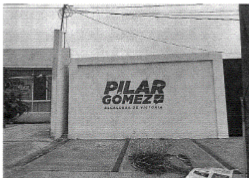
26.- CALLE MARIANO MATAMOROS ESQUINA CON CALLE F. DE LA GARZA, ZONA CENTRO, C.P. 87000, CIUDAD VICTORIA, TAMAULIPAS.