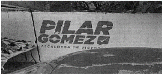
2.- AVENIDA ASENTAMIENTOS HUMANOS, ENTRE CALLE CONTADORES Y CALLE ARQUITECTOS, COL. BERNARDO GUTIERREZ DE LARA, C.P. 87160, CIUDAD VICTORIA, TAMAULIPAS.