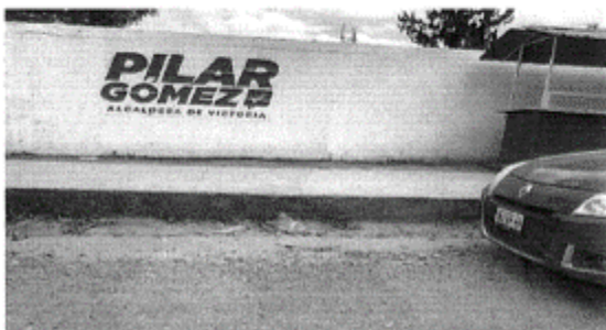
2.- CALLE JAIME RODRIGUEZ INURRIGARO, ENTRE LIRIO Y FLOR DE LIZ, COLONIA MODERNA, CP 87134, CIUDAD VICTORIA, TAMAULIPAS.