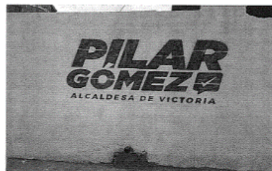
7.- CALLE AZTLAN ENTRE CALLE NUEVO LAREDO Y CALLE CARRERA TORRES, COL. AZTECA, C.P. 87086, CIUDAD VICTORIA, TAMAULIPAS.