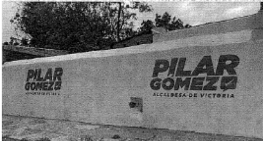
13.- CALLE JOSÉ NÚÑEZ DE CÁCERES ENTRE CALLE MUTUALISMO Y CALLE GONZÁLEZ, COL. GUADALUPE MAINERO, C.P. 87100, CIUDAD VICTORIA, TAMAULIPAS.