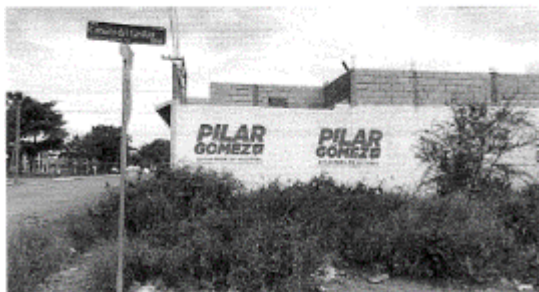
10.- CALLE DEL JILGUERO ESQUINA CON CALLE CIRCUITO DEL GAVILÁN, PAJARITOS, C.P. 87089, CIUDAD VICTORIA TAMAULIPAS.