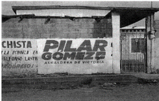
1.- CALLE ONIX, COL. LOMA ALTA, C.P. 87186, CIUDAD VICTORIA, TAMAULIPAS.