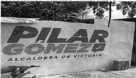
14.- CALLE REFINERIA ENTRE AV. LAS TORRES Y CALLE LAURO RENDON, LÁZARO CÁRDENAS, C.P. 87030, CIUDAD VICTORIA, TAMAULIPAS.