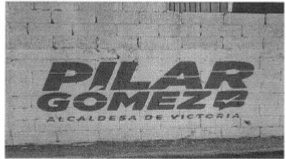
11.- CALLE PROL. DEMOCRACIA ENTRE CALLE PUERTA DEL SOL Y CALLE EMILIANO ZAPATA, COL. LUIS ECHEVERRIA, C.P. 87078, CIUDAD VICTORIA, TAMAULIPAS.