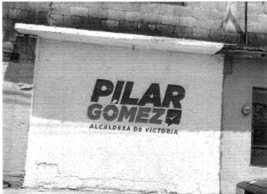
10.- CALLE DEL JILGUERO ESQUINA CON CALLE CIRCUITO DEL GAVILÁN, PAJARITOS, C.P. 87089, CIUDAD VICTORIA TAMAULIPAS.