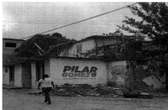
5.- CALLE REFORMA ESQUINA CON CALLE FRANCISCO I. MADERO, COL. LAS PALMAS, C.P. 87140, CIUDAD VICTORIA, TAMAULIPAS.