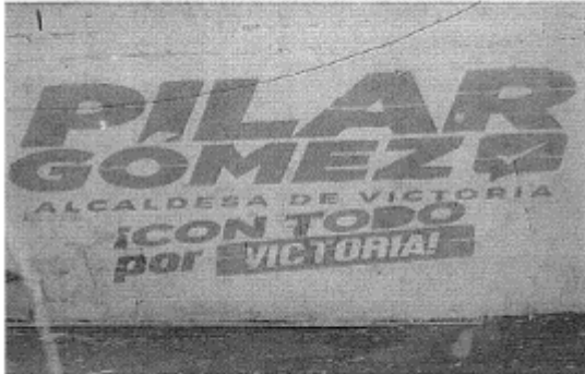
18.- CALLE BELICE ENTRE CAMINO A LA LIBERTAD Y LIBRAMIENTO NACIONES UNIDAS. COL. LA LIBERTAD, C.P. 87019, CIUDAD VICTORIA TAMAULIPAS