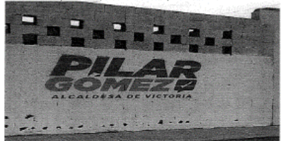
15.- CALLE MANGLAR ENTRE CALLE ENCINOS Y CALLE ÉBANOS, FRACC. FRAMBOYANES, C.P. 87018, CIUDAD VICTORIA, TAMAULIPAS.