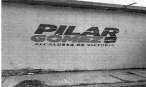
21.- CALLE VICENTE GUERRERO ENTRE PRIVADA GUERRERO BRAVO Y CALLE MARTIRES DE CANANEA, ZONA CENTRO C.P. 87000, CIUDAD VICTORIA, TAMAULIPAS.