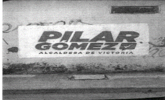
20.- CALLE CAMILO MANZO ENTRE CALLE IGNACIO ALLENDE Y CALLE NICOLAS BRAVO, ZONA CENTRO C.P. 87000, CIUDAD VICTORIA, TAMAULIPAS.