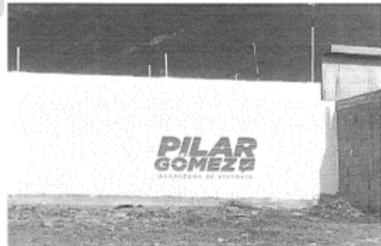
12.- CALLE PLAN DE AYALA ESQUINA CON CALLE ISIDRO OLVERA, COL. AMÉRICO VILLARREAL GUERRA, C.P. 87070, CIUDAD VICTORIA TAMPAS.